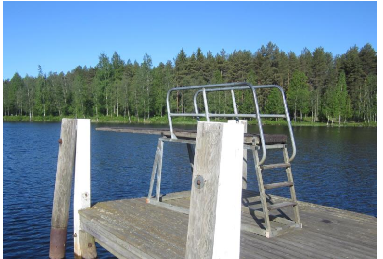
Pankalammen uimarannan ponnahduslauta.