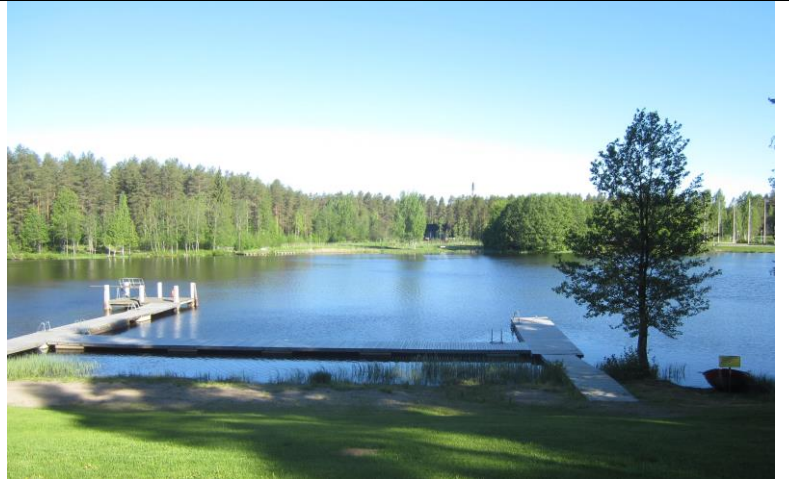
Pankalammen uimarannan laituri ja pelastusvene.