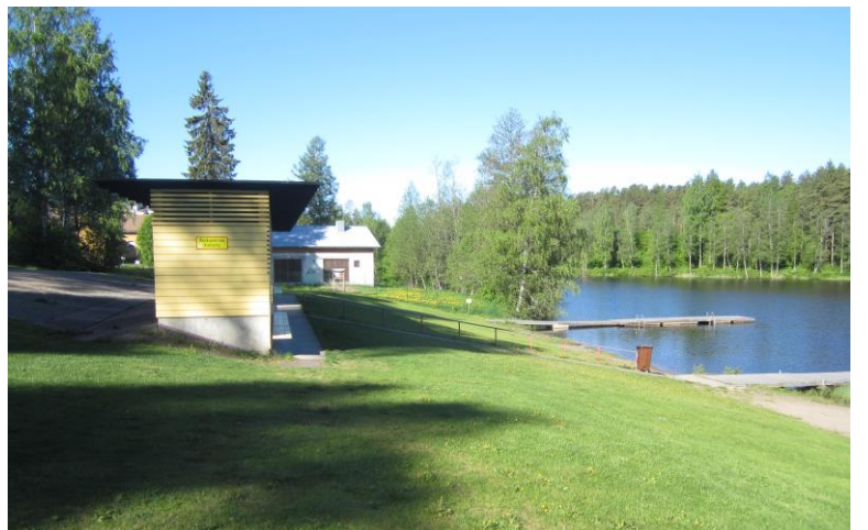
Pankalammen uimarannan nurmialue ja pukukopit. Taustalla näkyy toinen laituri ja ilmoitustaulu.