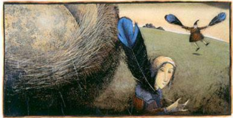
Harald Nordberg, Fuglejenta, 2001, guassi, 29x59,5 cm

Värihehkuinen, rikastekstuurinen kirjankuvitus on saanut vaikutteita historiasta. Kuvituksessa on hyvä kompositio ja hyvin aikaansaatu ilmapiiri.