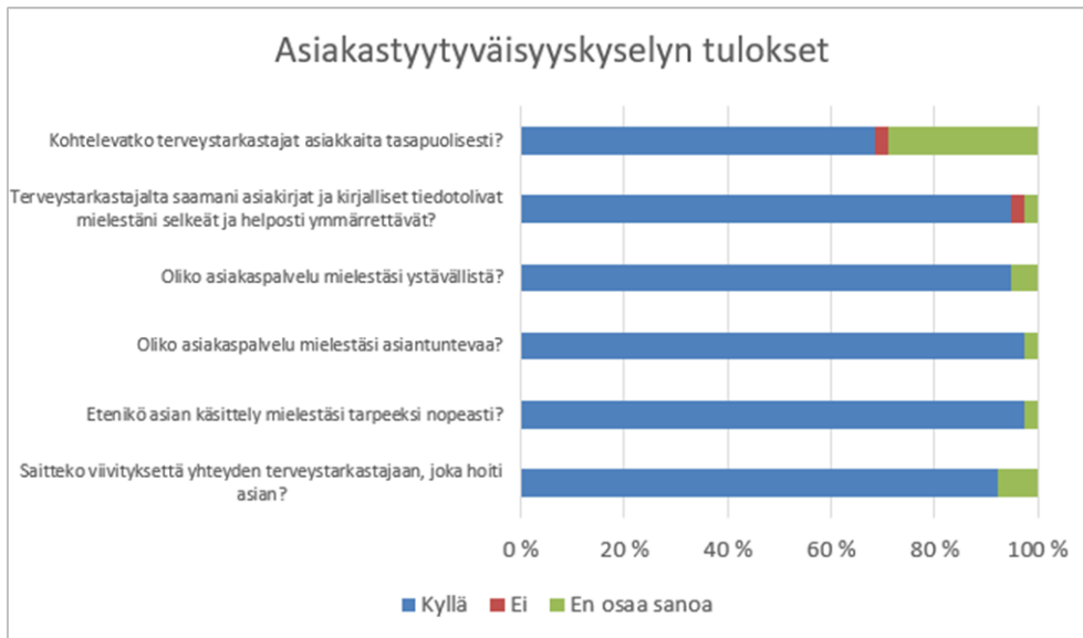
Taulukko 1. Asiakastyytyväisyyskyselyn tulokset osa 1.

Toisen kyllä, ei ja en osaa sanoa -kysymysosion (Taulukko 2) vastauksista selviää, että noin 90 % vastanneista pitää Oiva-tarkastusta hyödyllisenä ja terveystarkastajan ohjeistusta ja neuvontaa riittävänä. 60 % vastanneista kokee, että terveystarkastaja on perehtynyt kohteen tietoihin etukäteen.